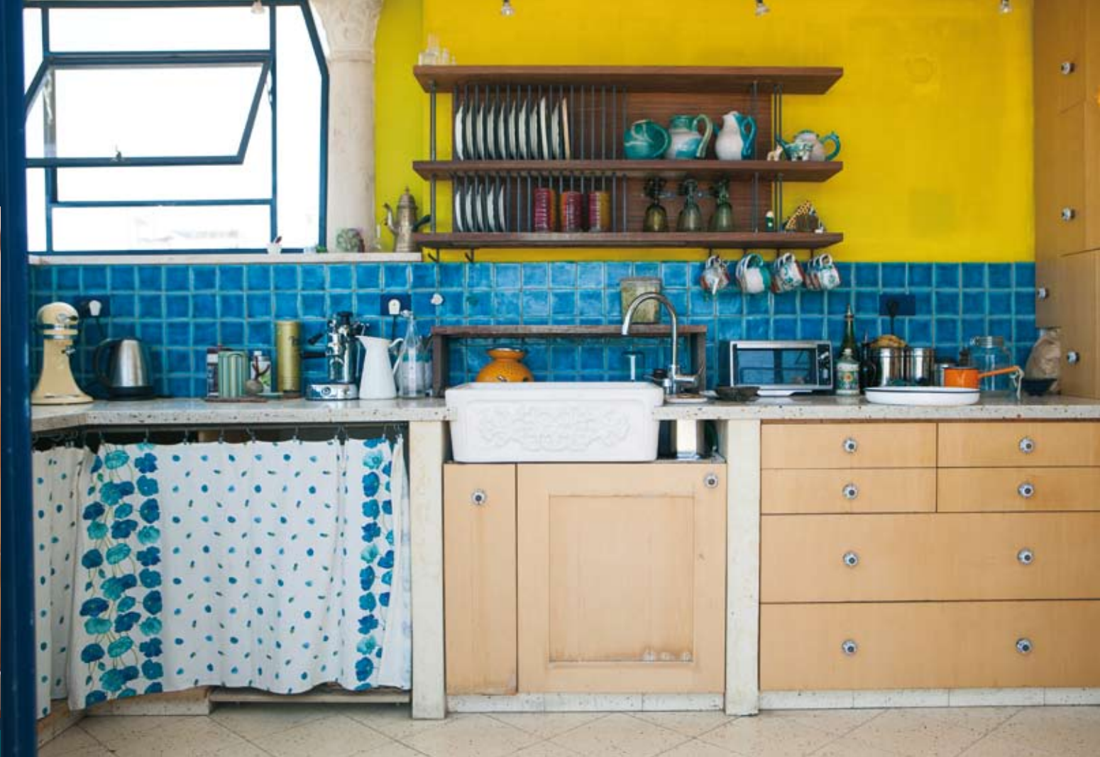
מימין למעלה: המטבח מימין במרכז ולמטה: בהר בסלון ואוסף האבנים שלה. וידיות הקרמיקה מעשה ידיה